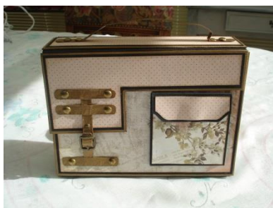
Alagina scrap you tube video 01/04/2016